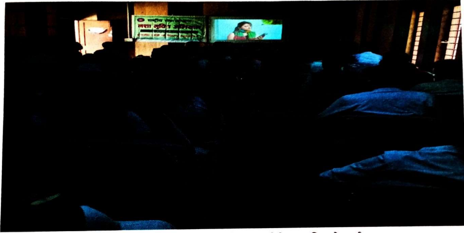
01 नवम्बर को नशामुक्ति पर महाविद्यालय के सेमिनार कक्ष में प्रेरक लघुफिल्म के प्रदर्शन का दृश्य