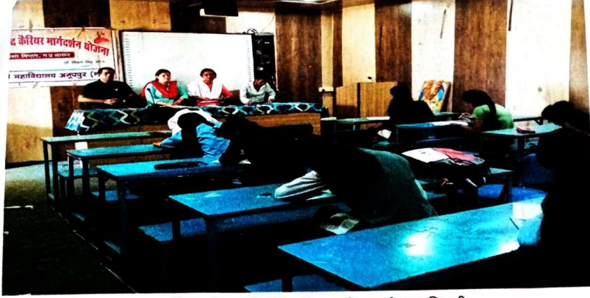
निबन्ध लेखन प्रतियोगिता में सहभागिता करते हुए प्रतिभागी