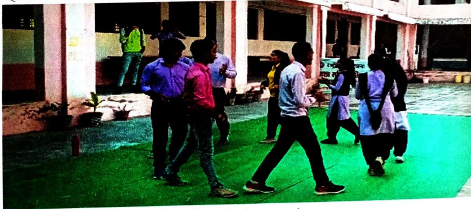
नुक्कड़ नाटक की प्रस्तुति करते छात्र-छात्राएं

नुक्कड़ नाटक नशामुक्त समाज पर केन्द्रित रही जिसमें राष्ट्रीय सेवा योजना इकाई के स्वयंसेवकों द्वारा महाविद्यालय परिसर में और अनूपपुर नगर के इंदिरा चौराहे पर रेलवे स्टेशन पर प्रदर्शन किया गया |