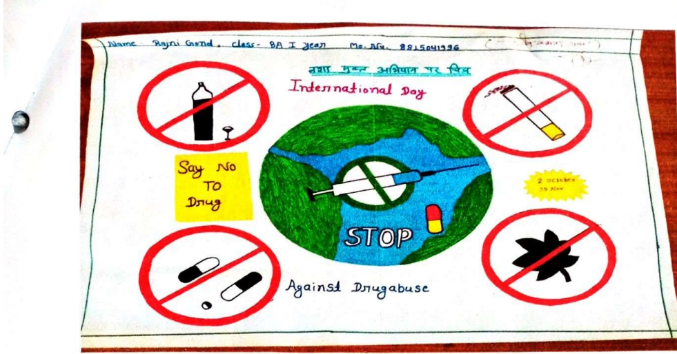
चित्रकला प्रतियोगिता के विजेताओं की ड्राइंग